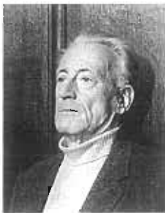
図1: アンリ・ルフェーヴル

フランスの哲学者。マルクス主義思想家であり、最も多作な人物として知られている。主な著作に『弁証法的唯物論』(1953)、『日常生活批判』(1947)、『都市革命』(1970)、『空間の生産』(1974)などがある。