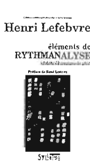
図2: アンリ・ルフェーヴル『リズム分析の諸要素：リズム分析への序説』