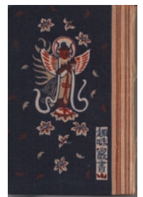
↑ 図 1. 『趣味叢書』書影