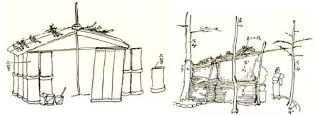
図2：避難小屋のスケッチ（『今和次郎集 4 住居論』）

しかし、この採集活動は民家採集の延長とだけでは捉えることは不十分である。今は震災直後にできた小屋とその後形成されるバラックは本質的に異なるものだと述べる。その違いとは「小屋とは自給経済のうちで営まれるものなのに対して、バラックはより大きい流通経済の社会に場合によって要求されるもの」であり、バラックは流通経済の最下級の住居形式である。