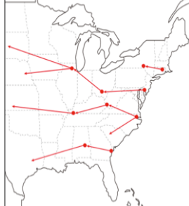
図3. アメリカの領土拡大