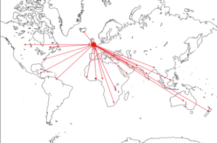
図2. 帝国の領土拡大

この特徴を踏まえると、第3章のユートピア思想からも、19世紀まではアメリカが帝國的な空間拡大を忌避しており、特有の空間形成文化が浸透していたが、19世紀末を境にアメリカ自身が帝國的な空間を展開したことがわかった。 この転換は、連邦主義的な権力の「都市」への凝集と、草の根民主主義的な「農村」の増殖との均衡が崩れたことに起因すると考察し、アメリカの特異性は、連邦主義と草の根民主主義の共存と、フロンティアがこの関係に与えた影響にあるとした。