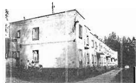
図2 パビのジードルンク Benedetto Gravagnuolo 『Adolf Loos: Theory and Works』(Idea Books, 1982) より

1925年にロースがウィーンを離れた後に設計した労働者住宅は、(1) パビのジードルンク (1931) (2) ウィーン工作連盟のジードルンク展の住宅の2つである。(1)はチェコに建設された労働者住宅で、ホイベルクと同様に菜園付き陸屋根で建設された。(2)は基本設計はロースが行ったが、実際に設計したのはクルカ 30 であった。