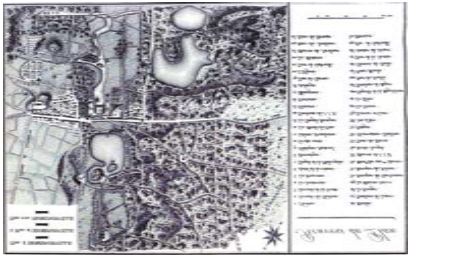
図1 Ermenonville 配置図

り、装飾用でありながらも農村として必要とされる機能に着想を得た構成となっている。それぞれの構造物は、池の周りを取り囲む有機的な形状の道に沿って配置されており、回遊的な構成である。構造物の周囲だけに着目すると、田畑が構造物に沿ったグリッド状に区切られており、建物ごとの小さい単位においては、幾何学的な構成も含まれていると言える。また、構造物の敷地周囲を囲むように道が作られていることや、池の片側に構造物が偏って配置されていることから、池の反対側から見た時の農村らしい景観のための装置としての側面が強いことがわかる。その一方で、それぞれの構造物に機能があてがわれ、近い距離にまとまって配置されていることは、より実際の農村に漸近した構成として捉えることができるのではないか。