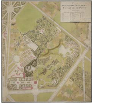
図2 Le Hemeau de la Reine 配置図