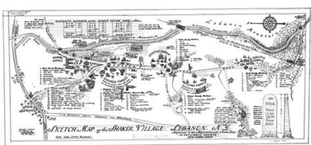
図3 Mount Lebanon 配置図

Church Family の配置図を見ると、それぞれの建物を結ぶ中心となる道は、直角に交差しており、建造物もグリッド状の配置がされていることが分かる。それぞれの建造物の入り口は道に面しており、中心的な建造物は道を取り巻くように回遊的な構成がされている。